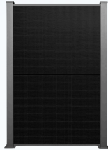
EFFICIENZA ab 299€