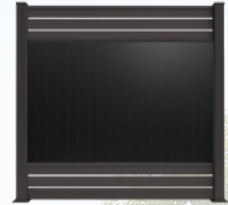
ALUNA ab 429€